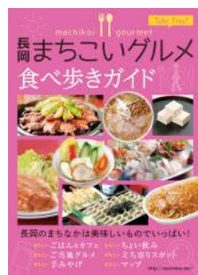
長岡まちこいグルメ食べ歩きガイド（秋）