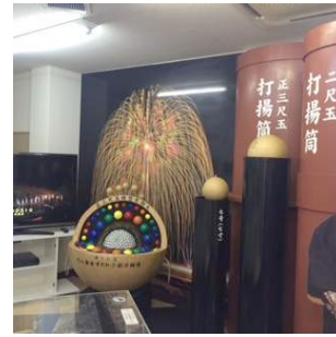
ながおかミニ花火ミュージアム