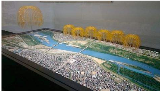
長岡の大花火 1/2700 模型