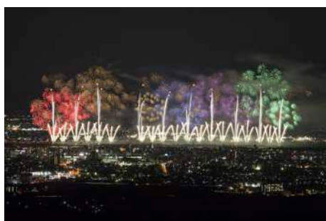
復興祈願花火フェニックス 10 (8月2日)