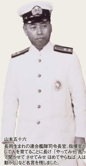
山本五十六 長岡生まれの連合艦隊司令長官。指揮官として人を育てることに長け「やってみせ 言わずで聞かせて させてみせ ほめてやらねば人は動かじ」など名言を残しました。

「米百俵」の志を受けつぐ長岡の偉人・山本五十六をテーマにしたまちなかイベントが、今年も開催されます。商店街の各店が工夫をこらした「五十六セール」や、ゆかりの味・品販売、さらに東日本大震災への支援企画など盛りだくさんの大手通りへ、家族みんなで出かけよう！