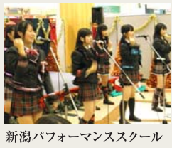
新潟パフォーマンススクール