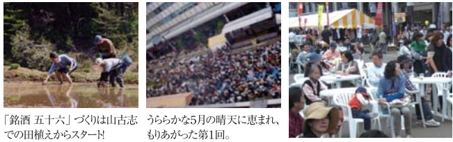
「銘酒 五十六」づくりは山古志での田植えからスタート！ うららかな5月の晴天に恵まれ、もりあがった第1回。

山本五十六をテーマにまちなかの活性化を図ろうと、大手通り商店街振興組合を中心に始まったイベント。五十六にちなみ昨年5月16日に行われた第1回は、3万5千人の人数が大手通りにあふれました。また、ここでしか買えない商品を開発する「五十六ブランドプロジェクト」から、「銘酒五十六」が誕生。今年1月に発売され話題を呼んでいます。