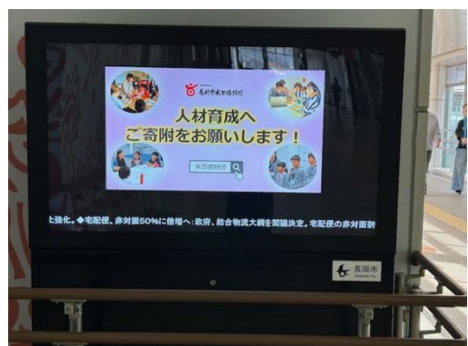
(まちなかサイネージ)