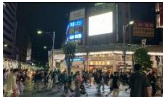
(フェニックスビジョン)